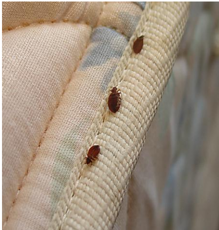
Las Chinches de Cama se Congregan En las Costuras del Colchón