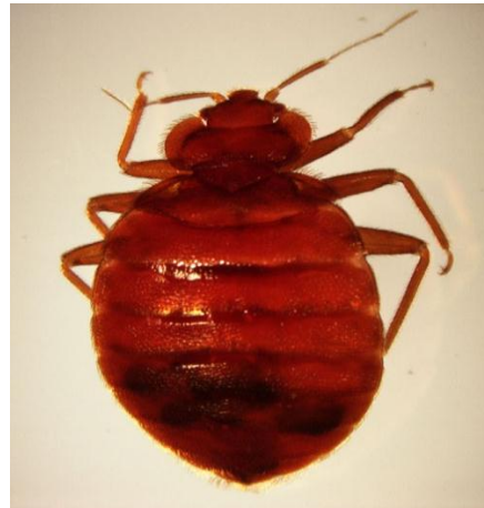
Tamaño Chinche Adulto