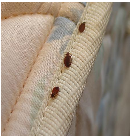
गद्दों में फंसे खटमल